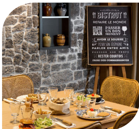
Bistrot Auvergnat de l'Hôtel Ibis Vichy***

Nos établissements sont situés à seulement 5 min à pied du Palais des Congrès de Vichy (opéra, auditorium, salles de réception et de réunion).