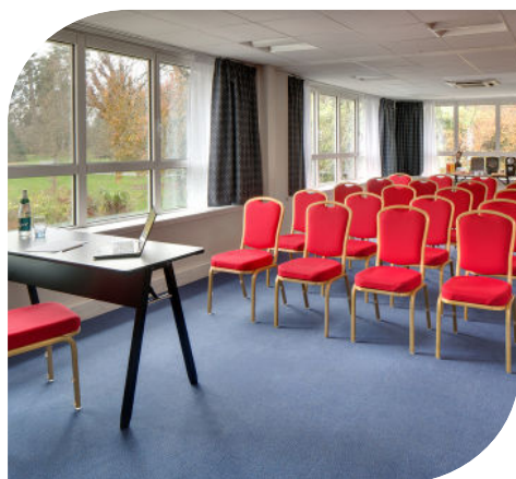
Célestins Spa Thermal & Hôtel*****